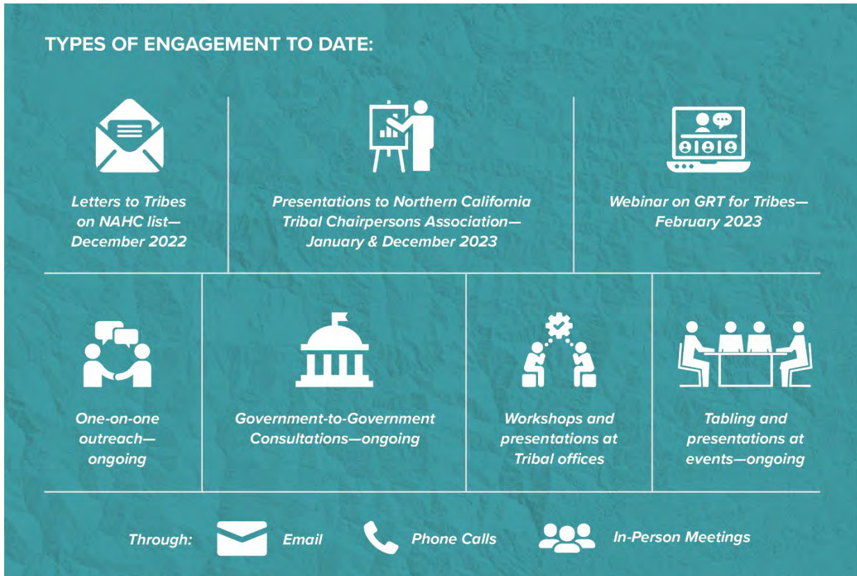
Interacciones públicas hasta la fecha.