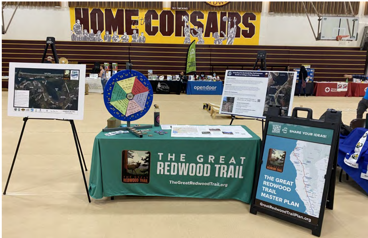
Las presentaciones en eventos comunitarios, como el Festejando Nuestra Comunidad en College of the Redwoods, permitieron al equipo del proyecto compartir información y recopilar ideas.