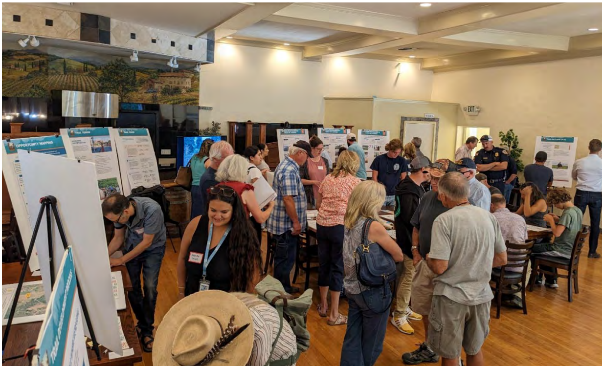
Los miembros de la comunidad se unieron al equipo del proyecto para un taller en Brutocao Cellars en Hopland en julio pasado.